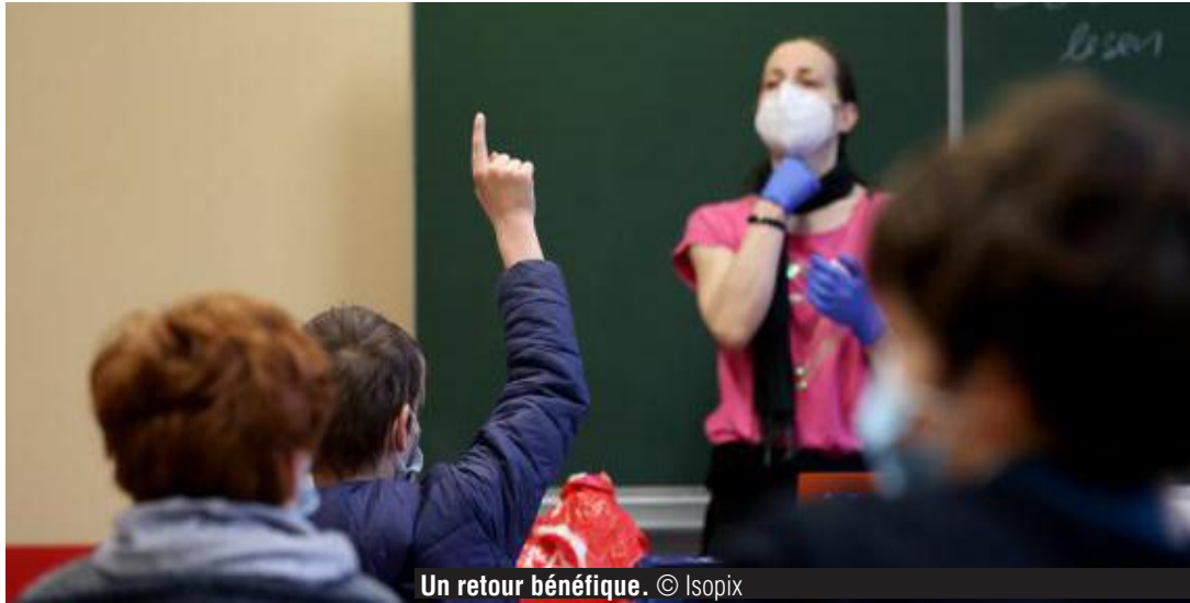
Un retour bénéfique.

suivre des cours à distance est plus facile qu'à 14 ou 15 ans, ce retour fera du bien au niveau de la santé mentale. Olivier Luminet re-