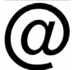
Deproost, Paul-Augustin. Étude des héritages grec et latin dans les littératures européennes (Site pédagogique) Itinera Electronica, 2013.