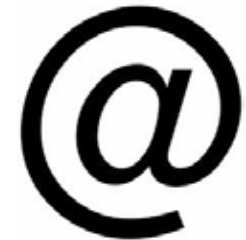
Deproost, Paul-Augustin. Site pédagogique consacré à l'étude de la tragédie Médée de Sénèque Itinera Electronica, 2013.