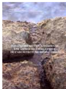
Devolder Maud Construire en Crète minoenne. Une approche énergétique de l'architecture néopalatiale Peeters : leuven, 2013.