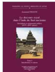
Francis, Emmanuel. Le discours royal dans l'Inde du Sud ancienne... Vol. 1 (Publications de l'Institut Orientaliste de Louvain, 64), 2013.