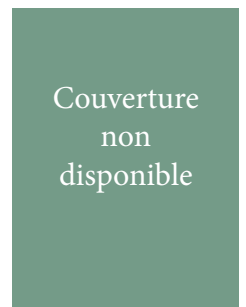
Maeder, Costantino (éd.). Music, Semiotics, Intermediality. E-Proceeding of the XII th International Congress on Musical Signification. Abstracts and Extended Abstracts , Reybrouck, Mark. Lln, 2013.